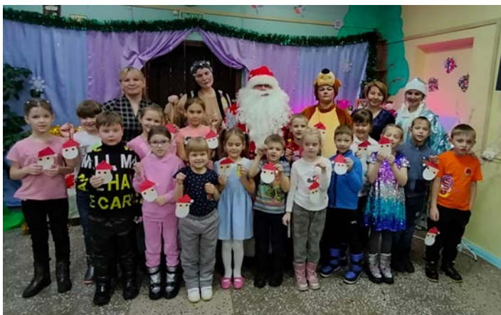
День рождение Деда Мороза