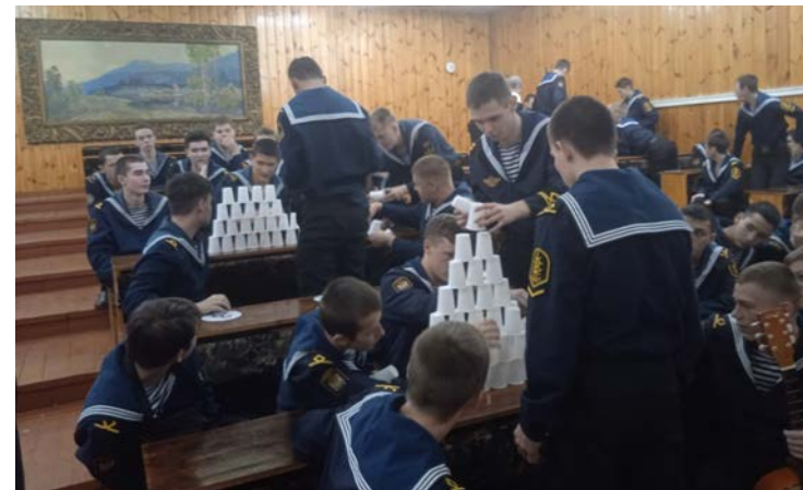
День народного единства