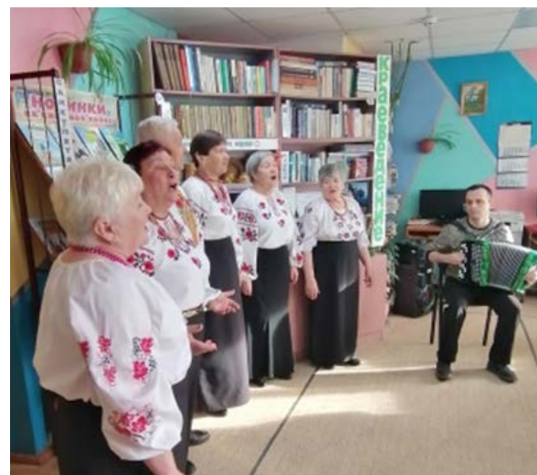
День пожилого человека