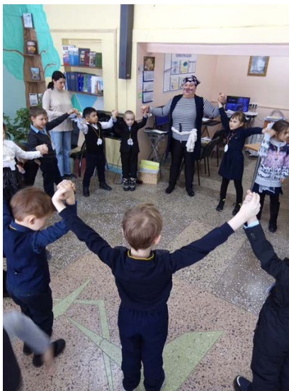
Квест по сказкам К.И.Чуковского