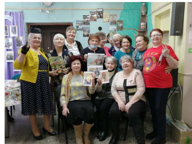
Назад в СССР