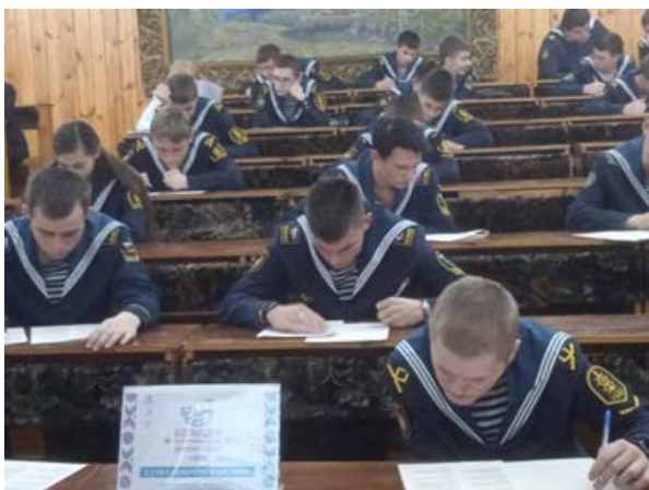
Большой этнографический диктант