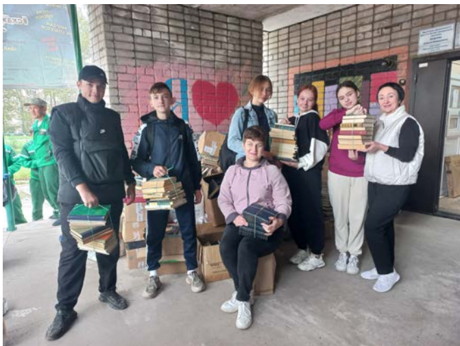
Скажи мусору нет!